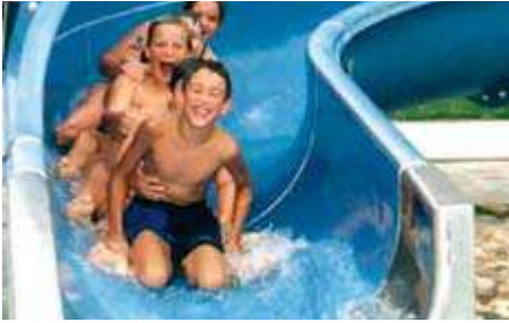
1_ Suda eğlence yaşama zevinci verir.

A – 4710 Griesskirchen, Badstrasse 19 Tel: 0043 (0) 7248 / 62 580