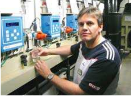
1-2_ Grander montajı çok kolay